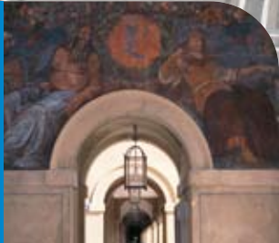
Das Tor zum Münchener Hofgarten