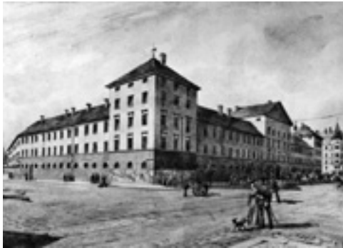
Die Schwere-Reiter-Kaserne nach einem Aquarell von 1902.

1953 wurde der Bau zugunsten des Neubaus des Deutschen Patentamtes abgerissen, das in Berlin ausgebombt worden war und eine neue Heimstatt brauchte. Auf dem danebengelegenen Gelände des Corneliusgefängnisses, das ein Gerichts- und ein Arrestgebäude umfasst hatte, entstand seit 1975 der mondäne Komplex des Europäischen Patentamtes.