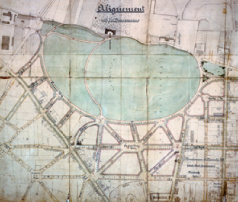
Der Bebauungsplan für das Theresienwiesenareal von 1882.

Parallel zur Weiterentwicklung der Ludwigsvorstadt im dem Villenquartier um den Bavariaring bildete sich nach der Eröffnung des Südbahnhofs und des Schlacht- und Viehhofs in den 1870er Jahren ein Arbeiterquartier im heute so genannten Schlachthofviertel heraus. Auch in dem in der Südost-ecke des Stadtbezirks gelegenen Dreimühlenviertel siedelten sich Industriebetriebe an, die mit Elektrizität und