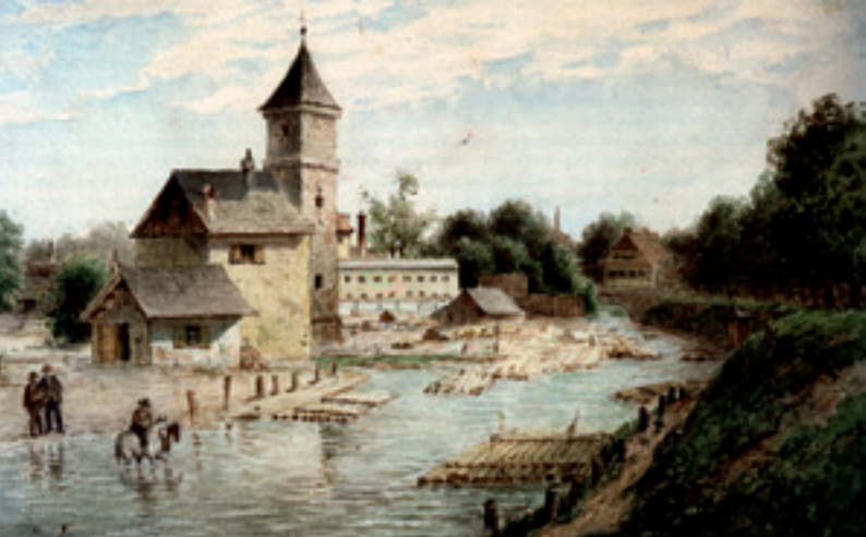
Die »Obere Lände« mit dem Brunnhaus, Aquarell um 1870.

Schon bevor die systematische Stadterweiterung die Ludwigs- und Isarvorstadt schuf, ergaben sich städtische Aufgaben eben gerade aus der Lage des Gebiets »extra muros«. Ein Pesthaus entstand an der heutigen Baumstraße, vor allem aber wurde mit der Eröffnung eines Pestfriedhofs Ende des 16. Jahrhunderts der Grundstein für die Entstehung des »Südlichen Friedhofs« gelegt. Städtebaulich stellt der Alte Südfriedhof die Grenze oder auch das Verbindende zwischen der Ludwigs- und der Isarvorstadt dar. Auch im Gelände ist das erkennbar: