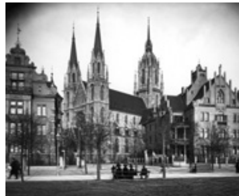
St. Paul auf einer Aufnahme von Pettendorfer, um 1910.

Auf dem weiteren Weg, am Bavariaring 5, kommen wir am Volksbrausebad vorbei, das Stadtbaurat Hans Grässel 1894 errichten ließ. Damals stand der polygonale Bau, der mit Zentralheizung und fließend Wasser ausgestattet war, für eine moderne öffentliche Hygiene.