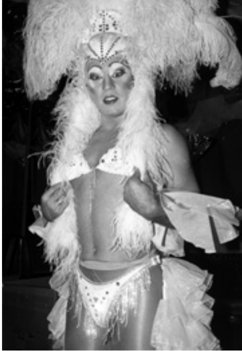
Travestiekünstler im »Old Mrs. Henderson«, 1993