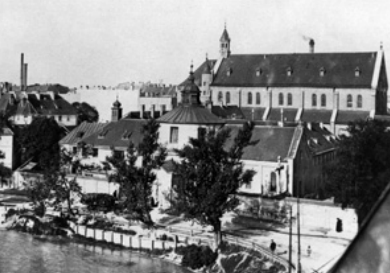
Im Vordergrund der Westermühlbach, im Hintergrund die Klosterkirche, Aufnahme von 1900. Die Ordensregeln erlaubten keinen Turmbau, und so gibt es nur einen bescheidenen Dachreiter mit Wetterhahn und kleiner Glocke.