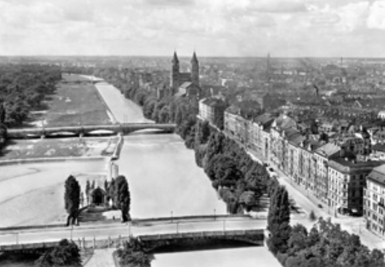
Blick von der Cornelius- bis zur Braunauer Eisenbahnbrücke und auf die Isarvorstadt mit der Kirche St. Maximilian, um 1920.

Der so dicht und urban wirkende Bezirk machte jedoch keineswegs eine kontinuierliche Entwicklung vom mittelalterlichen Gründungsakt der Stadt bis heute durch, sondern entstand im Wesentlichen erst im 19. Jahrhundert. Dennoch gibt es eine punktuelle und sich ebenfalls vor allem auf das Wasser beziehende Vorgeschichte im Mittelalter: So landeten an der Kohleninsel (heutigen Museumsinsel) und am linken Isarufer die Isarflöße an, hier entstand ein regelrechter »Verkehrsknotenpunkt«. Auch die aus der Isar abgeleiteten Stadtbäche waren Lebensnerv für das frühe