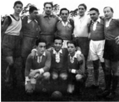
Das Handballteam des jüdischen Turn- und Sportvereins Bar-Kochba, um 1930. Der Bar-Kochba-Stammtisch traf sich montags in der Gaststätte Fraunhofer.

Homosexuelle galten den Nationalsozialisten generell als Staatsfeinde und Verbrecher – vor allem gegen das Dogma der Vermehrung des deutschen Volkes. Während für sie aber noch Überlebenschancen bestanden, weil die Verfolger an die »Umerziehbarkeit« – gegebenenfalls auch durch Kastration – glaubten, ließ der radikale Antisemitismus des NS-Staates keine solchen Lücken für die jüdische Bevölkerung. Sie hatte sich besonders mit der ostjüdischen Zuwanderung seit dem ausgehenden 19. Jahrhundert zu einem hohen Anteil im »Kleine-Leute-Viertel« Isarvorstadt niedergelassen.