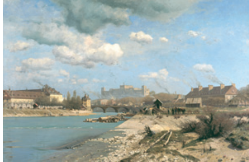
Otto Strützel, Floßlande auf der Kohleninsel, 1889. An der Kohleninsel landeten jährlich bis zu 12.000 Flöße, es war der größte Floßhafen Europas.

1903 gründete Oskar von Miller das »Deutsche Museum für Meisterwerke der Naturwissenschaft und Technik«, das zunächst provisorisch im alten Nationalmuseum und in einer Kaserne untergebracht war. Nachdem die Stadt die ehemalige Kohleninsel als Standort anbot, begann Gabriel von Seidl mit dem Sammlungsbau. Die feierliche Grundsteinlegung erfolgte in Anwesenheit Kaiser Wilhelms II., die Fertigstellung verzögerte sich bis 1925. Im Dritten Reich wurde das Museum zwar ausgebaut, aber auch für den antisemitischen Feldzug der Nazis missbraucht. 1937 präsentierten sie im Bibliotheksbau die Hetz-Ausstellung »Der ewige Jude«. Trotz solcher Rückschläge hat sich das Museum mit didaktischen Erfindungen und Weltneuheiten, wie dem Projektionsplanetarium, zum größten und modernsten seiner Art entwickelt. 1931 konnte man hier die erste Fernsendung bestaunen. 1969 drängelten sich die Besucher, um die Raumkapsel Apollo 8 zu sehen, mit der zum ersten Mal Menschen den Mond umrundeten. Mit 1,2 Millionen Besuchern jährlich ist es Deutschlands meistbesuchtes Museum. (N. Zimmer)