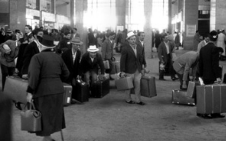
Ankunft von Italienern im Starnberger Flügelbahnhof, 1960.

Die ersten »Gastarbeiter« kamen aufgrund des deutsch-italienischen Anwerbevertrags vom 20.12.1955 nach Deutschland, Verträge mit anderen Nationen folgten, so 1961 mit der Türkei. Heute lebt oft schon die zweite und dritte Generation der Einwanderer in München; Integration ist aber, wie sich etwa im Bildungssystem alarmierend zeigt, bei weitem kein abgeschlossener Vorgang.