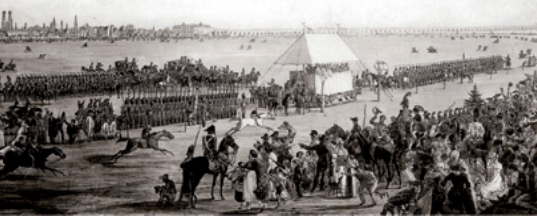
Erstes »Oktoberfest« anlässlich der Hochzeit von Kronprinz Ludwig, 1810, auf einem Bild von Peter Hess.