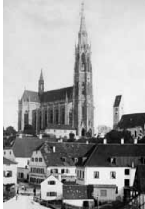
Links die neue und rechts die alte Heilig-Kreuz-Kirche im Jahr 1886.

An der Ecke Ichostraße/Tegenseer Landstraße, wo bis August 2009 Hertie (vormals Karstadt) untergebracht war, befand sich einst die Gastwirtschaft »Schweizerwirth«. Sie diente dem Giesinger Faschingsverein als Hauptquartier und wurde durch den Hundemarkt, der nach dem Zweiten Weltkrieg dort abgehalten wurde, bekannt.