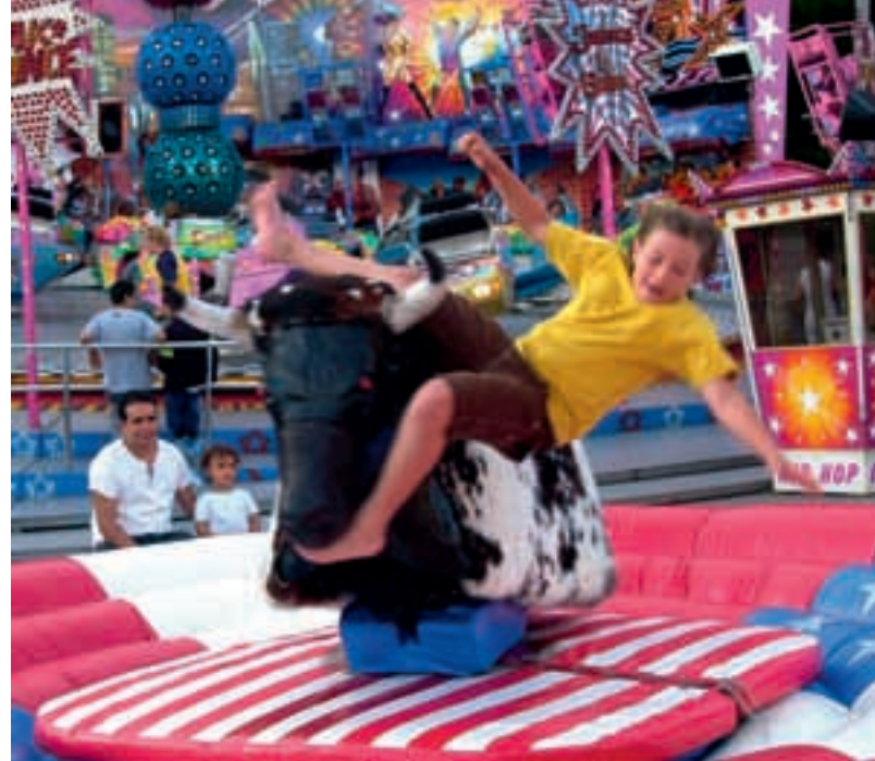
Bullenreiten auf dem »Little Oktoberfest«, das als deutsch-amerikanisches Volksfest von 1956 bis 2005 in der US-amerikanischen Siedlung am Perlacher Forst stattfand. Aufnahme aus dem Jahr 2001.

Nach dem Zweiten Weltkrieg ließen sich die US-Truppen in Obergiesing nieder. Sie prägten den Stadtbezirk und hinterließen auch nach ihrem Abzug 1992 Spuren. Im Mai 1945 bezog die US-Militärregierung für Bayern die ehemalige Reichszeugmeisterei in der Tegernseer Landstraße, am Perlacher Forst entstand eine Siedlung für die US-Soldaten und deren Familien und im Dezember 1971 eröffnete Deutschlands erster McDonald's in der Martin-Luther-Straße 26. Heute unterhält Obergiesing eine Stadtteilpartnerschaft mit dem Colerain Township, einem Stadtteil von Münchens Partnerstadt Cincinnati.