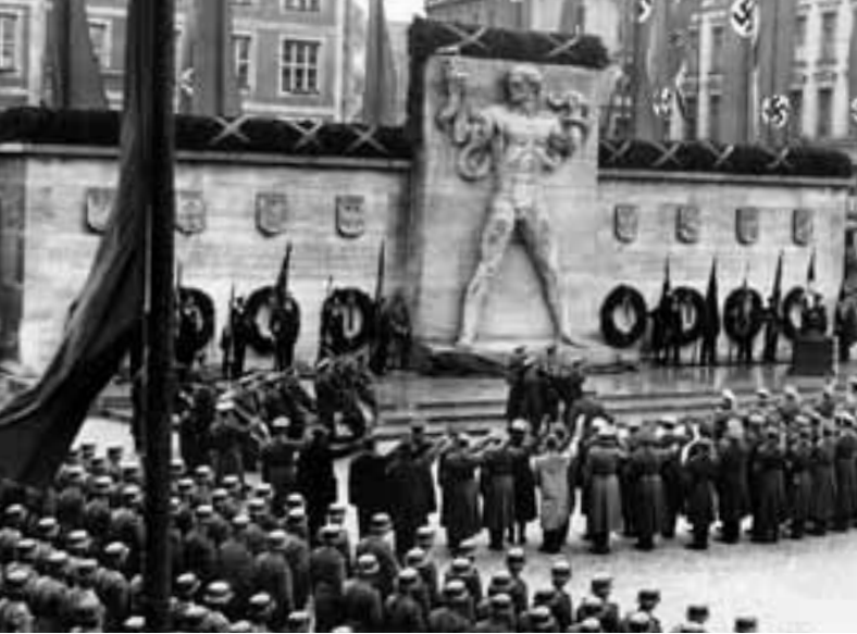
Einweihung des Freikorpsdenkmals am 3. Mai 1942.

Dieses wurde am 3. Mai 1942 von Oberbürgermeister Karl Fiehler enthüllt und stellte einen 10 Meter großen nackten Mann dar, der mit bloßen Händen eine Schlange erwürgt.