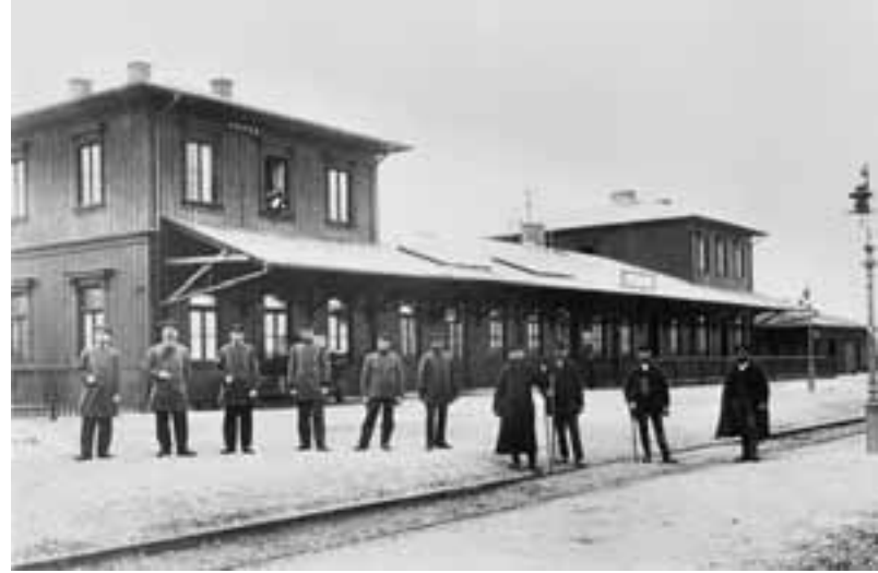
Das Bahnhofsgebäude wurde 1985 als eines der letzten Vorstadtbahnhofsgebäude Münchens unter Denkmalschutz gestellt. Der Verfall des Gebäudes wurde gestoppt und 2004 zog das Stadtteil-Kulturzentrum Giesinger Bahnhof ein. Träger ist der 1979 gegründete Verein der Freunde Giesings. Neben Veranstaltungsräumen sind hier eine Gaststätte und das Archiv der Freunde Giesings untergebracht. Das Foto von 1900 zeigt das Empfangsgebäude mit Stationsvorstand und Bediensteten.

Von den Industriebetrieben, die sich schon bald in Bahnhofsnähe ansiedelten, liegen beziehungsweise lagen viele jenseits der Grenzen des heutigen Stadtbezirks 17. Darunter der petrochemische Betrieb Deiglmayr an der Aschauer Straße (vormals Stadelheimer Straße), die Kaffeerösterei Dallmayr, eine Bettfedernfabrik, das nicht fertig gestellte »Kriegsmetallwerk München Süd-Ost« der Firma Siemens & Halske an der Ständlerstraße (später Straßenbahn-Hauptwerkstätte), die Optischen Werke Steinheil und die »Schaltbau«. Im heutigen Obergiesing ließen sich die Karosseriefabrik Beißbarth, der feinmechanische Betrieb von Wilhelm Sedlbauer und die Firma Agfa mit ihrem Kamera-Werk an der Tegernseer Landstraße nieder.