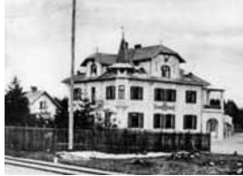
Das direkt an der Lokalbahnstrecke gelegene Ausflugslokal »Fasanengarten« im Jahr 1903.

Nachdem die US-Streitkräfte München verlassen hatten, bezogen Münchner Familien die Siedlung. Auch die übrige Infrastruktur wurde von neuen Nutzern übernommen: In der ehemaligen amerikanischen Schule ist heute das Schulzentrum Perlacher Forst mit Grund-, Haupt- und Berufsschule untergebracht (Cincinnatistraße 63). An die amerikanische Zeit des Schulkomplexes erinnert die denkmalgeschützte Cafeteria. Das einstige Army-Hospital wurde zwischenzeitlich von der Bundeswehr genutzt und beherbergt heute das Bundespatentgericht (Cincinnatistraße 64).