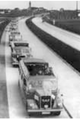
Omnibusfahrt auf der neuen Reichsautobahn als inszenierte Wohltat für kinderreiche Mütter an Hitlers Geburtstag, 20.4.1937