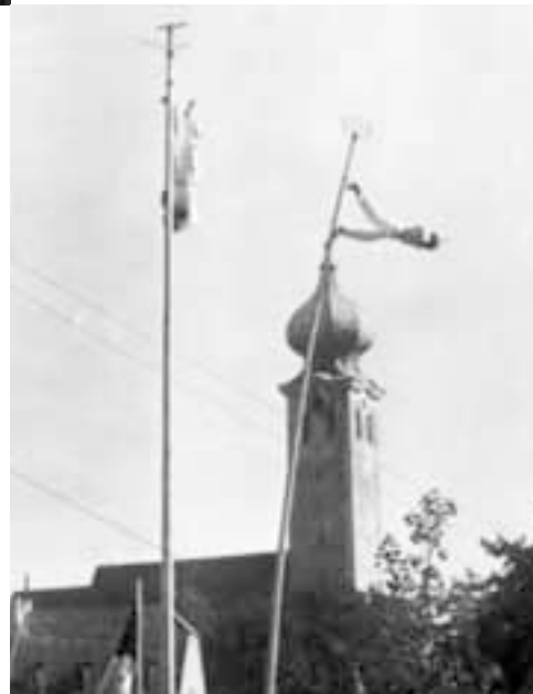
Felix und Harry Schweizer in 20 Meter Höhe, um 1950