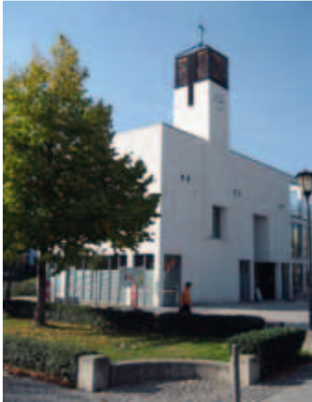
Kubischer Sakralbau – die Dietrich- Bonhoeffer-Kirche.

Der Weg führt über den kleinen Echo-Park weiter zum Perlach-Park – beide sind typisch für den hohen Grünflächenanteil von Neuperlach. An der evangelischen Dietrich-Bonhoeffer- und der katholischen Maximilian-Kolbe-Kirche vorbei kommen wir nach Neuperlach-Süd.