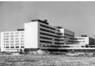
Eine Aufnahme aus der Frühzeit des Krankenhauses in den 1970er Jahren