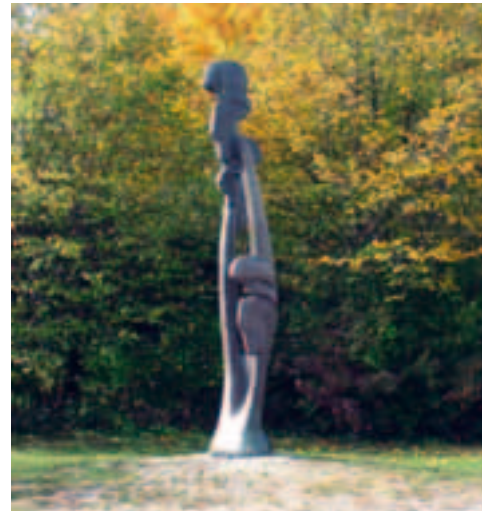
Kunst im Perlach-Park.

Der Weg führt an der Europäischen Schule vorbei, die 1977 in erster Linie für die Kinder von Angestellten des Europäischen Patentamtes gegründet wurde. Auch in anderen Mitgliedsstaaten der EU gibt es solche Schulen, die die Jugend mit dem europäischen Geist und den Sprachen Europas vertraut machen sollen.