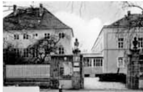
Das ehemalige Schlossgebäude von Perlachort (links) wurde von 1886 bis 1950 als Altersheim benutzt und dann zum Verwaltungsgebäude des Krankenhauses gemacht. Postkarte um 1950

Als in den 1880er Jahren der Distrikt München-Land das Krankenhaus an dieser Stelle errichtete, wurde das Schloss zunächst zum »Asyl«, einem Altersheim, umgebaut. Wie in der Klinik selbst übernahmen auch hier die Mallersdorfer Schwestern die Pflege. Einige bäuerliche Anwesen wurden gleich abgerissen; andere Gebäude fielen erst späteren Modernisierungen und Erweiterungen zum Opfer.