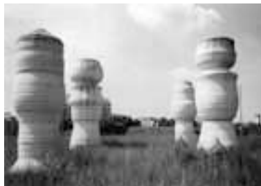
Die Kegelkörper des koreanischen Künstlers Jai Young Park an der Ständler-/Heinrich-Wieland-Straße