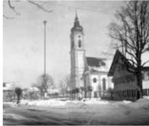
Anstelle des Mai- baums ließen die Nationalsozialisten einen braunen Holz- masten mit Haken- kreuz am Pfanzelt- platz errichten.