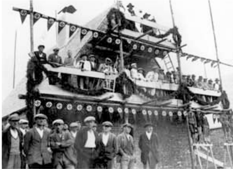
Richtfest in Ramersdorf am »Geburtstag des Führers«, 20.4.1934. Die Hakenkreuzbeflaggung und die Benennung der Straßen in der Siedlung nach den Toten des Hitler-Putsches von 1923 unterstrichen die propagandistische Absicht des Siedlungsprojekts.

Ein Jahr nach der Fertigstellung der Wohnhäuser wurde 1935 auch die Gustav-Adolf-Kirche in der Siedlung als erste protestantische Kirche in Ramersdorf eröffnet.