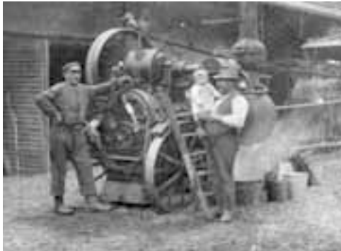
Eine Dampfdreschmaschine der Perlacher Firma Platten auf dem Schreihof, um 1927

Alte Gewerbe wie die Ziegelbetriebe wurden modernisiert, neue kamen vor allem entlang der Bahnlinie hinzu, und die Einwohnerzahl von Ramersdorf stieg rasant an. Perlach blieb in seiner Entwicklung lange dörflich-abgeschiedener, und sein Gewerbeleben ging noch bis ins 20. Jahrhundert über ländliche Handwerksbetriebe wenig hinaus. Allerdings entstanden auch auf Perlacher Flur nach der Jahrhundertwende neue Siedlungsschwerpunkte: Fasangerien im Bereich der ehemaligen kurfürstlichen Fasanerie, Michaeliburg zwischen Berg am Laim und Trudering und eine Kolonie im Perlacher Wald – eben Waldperlach. Erst 1930 wurde Perlach nach München eingemeindet und bildete ein Jahr später zusammen mit Waldperlach und Ramersdorf den neuen 30. Stadtbezirk (heute Stadtbezirk 16).