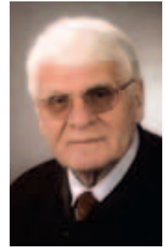
Christian Ude Oberbürgermeister