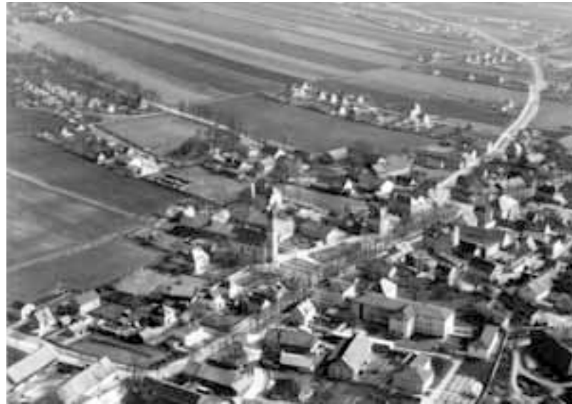
Vogelperspektive vom Perlacher Ortskern 1958

Nach dem Krieg und einer Phase des Wiederaufbaus setzte um das Jahr 1960 eine Epoche rasanter Modernisierung in München ein. Östlich von Perlach entstand, auf noch weitgehend unbebauter Flur, seit Ende der 1960er Jahre die »Entlastungsstadt Neuperlach«. Ramersdorf bekam mit dem Ausbau des Innsbrucker Rings vor allem die Kosten der »autogerechten« Stadt zu spüren.