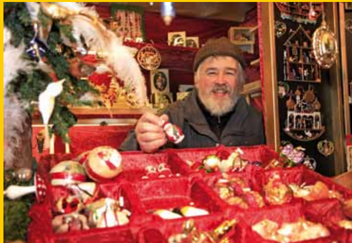
Tradizionali addobbi natalizi di stagno e vetro

• Ufficio Postale del Christkindmarkt: nel passaggio verso il cortile del municipio (Prunkhof): 26.11. – 4.12.2011, aperto tutti i giorni ore 12.00 – 18.00.