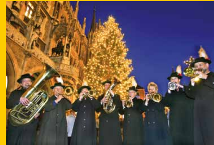
Musica alpina dell'Avvento con il gruppo "Isartaler Blasmusik"