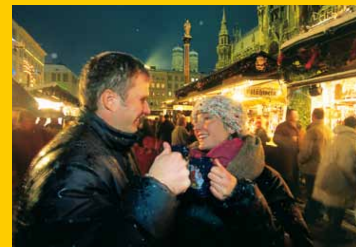
Un bicchiere di vin brulé nella Marienplatz