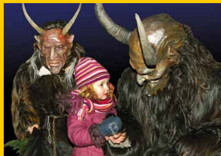
Sfilata dei Krampus con il gruppo "Sparifankerl Pass"