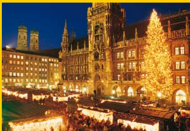
Punto d'incontro preferito: l'albero di Natale davanti al Municipio di Monaco

Prenotabili esclusivamente per gruppi presso l'Ente del Turismo: gf.tam@muenchen.de , Fax +49 (0) 89 233-30 337 Informazioni: Tel. +49 (0) 89 233-30 234 oppure -30 204