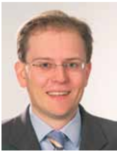
Manuel Pretzl CSU

Geboren am 7. September 1975 in München, röm.-kath., verheiratet, Diplom-Kaufmann.