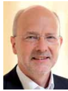
Rainer Schweppe Stadtschulrat

Geboren 1958 in Rain am Lech, seit 1960 in München, verheiratet, drei Kinder. 1981 Abschluss der Beamtenfachhochschule als Dipl. Verwaltungswirt (FH). 1982 bis 2008 in der Stadtkämmerei München in wechselnden Funktionen, zuletzt als Stadtdirektor und Stellvertreter des Stadtkämmerers. Seit April 2009 Referent für Arbeit und Wirtschaft, verantwortlich für regionale und Internationale Wirtschaftspolitik u. -förderung, kommunale Beschäftigungs- und Qualifizierungspolitik, Tourismus und Oktoberfest, Beteiligungsmanagement für die Stadtwerke München, die Flughafen München GmbH, die Messe München GmbH, die Olympiapark GmbH u.a.m. Aufsichtsrat ARGE München GmbH, Münchner Gewerbehof GmbH, Flughafen München GmbH u.a.m. Mitgliedschaften in verschiedenen Kuratorien.