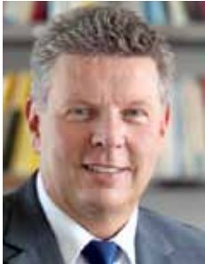
Dieter Reiter Referent für Arbeit und Wirtschaft

Geboren 1963 in Regensburg. 1988 bis 1994 Tätigkeit in Architektur/Denkmalpflege sowie Promotion in Florenz. 1995 bis 1998 Gestaltung/Konzeption neuer U-Bahnhöfe u. Plätze in München. 1999 bis 2000 verantwortlich für Stadtgestaltung u. städtebauliche Denkmalpflege in Regensburg. 2000 bis 2006 Leiterin der Stadtentwicklung u. Stadtplanung in Halle/Saale. 2005 bis 2007 Professorin für Städtebau/Stadtplanung (HFT Stuttgart). Seit 2007 Stadtbaurätin in München. Seit 2009 Honorarprofessorin (HFT Stuttgart). Gast im Bau- und Verkehrsausschuss des Dt. Städtetags. Mitglied im Bau- u. Planungsausschuss des Bayerischen Städtetags, im Unesco Network conservation of modern architecture and integrated territorial urban conservation, im Internationalen Rat für Denkmalpflege (ICOMOS), in der Dt. Akademie für Städtebau und Landesplanung und im Kuratorium Nationale Stadtentwicklungspolitik.