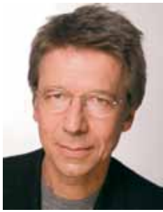
Siegfried Benker Bündnis 90/ Die Grünen

Geboren 1957 in Erlangen, drei Töchter, verheiratet.