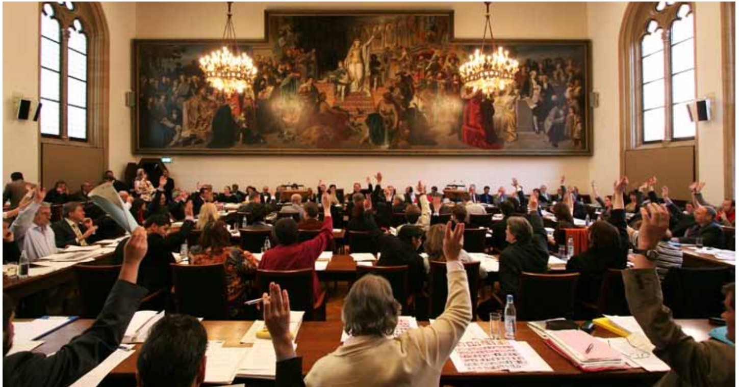
Vollversammlung des Münchner Stadtrats