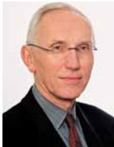
Dr. Wilfried Blume-Beyerle Kreisverwaltungsreferent

Die berufsmäßigen Stadtratsmitglieder besorgen im Auftrag des Oberbürgermeisters innerhalb ihres Geschäftsbereiches die laufenden Angelegenheiten. Sie haben im Rahmen ihres Geschäftsbereiches die Beschlüsse des Stadtrats vorzubereiten und im Auftrag des Oberbürgermeisters die Beschlüsse des Stadtrats zu vollziehen.