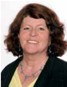
Jutta Koller Bündnis 90/ Die Grünen

Geboren am 11.2.1956 in München, verheiratet, vier erwachsene Kinder. Ausbildung als Technische Zeichnerin, Abitur an der BOS für Technik und Gewerbe.