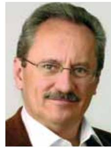
Christian Ude Oberbürgermeister (SPD)