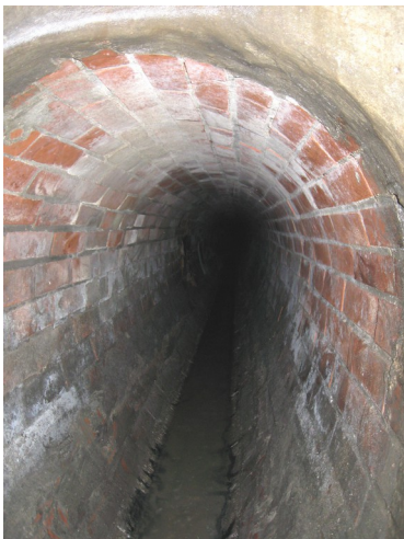
zu sanierender Kanal aus Mauerwerk