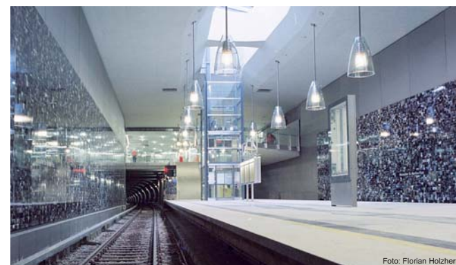
U-Bahnhof Moosacher St.-Martin-Platz