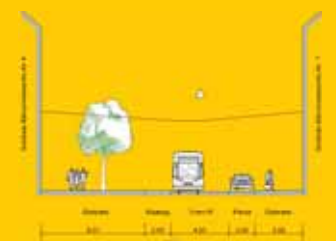
Schnitt D-D Planung