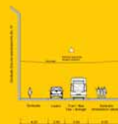
Schnitt C-C Planung