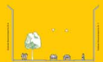
Schnitt D-D Bestand