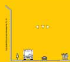
Schnitt C-C Bestand