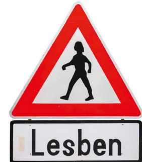
Protest-Schild „Lesben“ vom Christopher Street Day, München um 1995, forum homosexualität e.V.