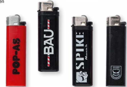
Feuerzeuge aus Bars der Münchner Schwulen-Szene, München 1995-2005, Münchner Stadtmuseum