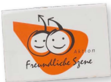
Streichhölzer aus Bars der Münchner Schwulen-Szene, München 1995-2005, Münchner Stadtmuseum

Das »Münchner Stadtmuseum«, das »Stadtarchiv München« und das »forum homosexualität münchen e.V. – Lesben und Schwule in Geschichte und Kultur« suchen gemeinsam nach Objekten und Unterlagen zur LGBTI*-Geschichte.