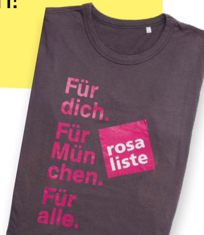
T-Shirt „Rosa Liste – Für dich. Für München. Für alle.“, München 2016, Münchner Stadtmuseum

Helfen Sie uns dabei, die Geschichte der Münchner Lesben-, Schwulen-, Bi-, Trans*- und Inter*- Communitys sichtbar zu machen und als Teil der Münchner Stadtgeschichte und Erinnerungskultur zu bewahren!