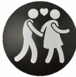
Ampelschablonen, © Kreativpiloten GmbH, Wien 2015, Münchner Stadtmuseum